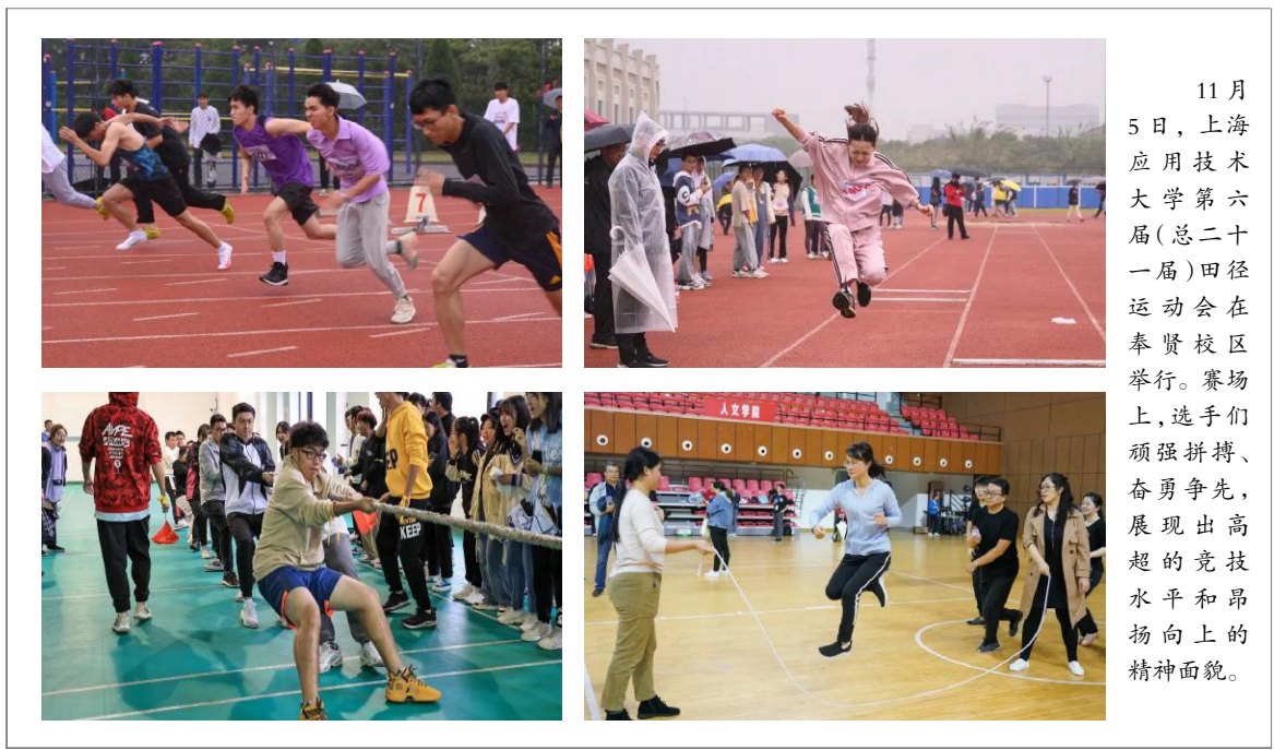
11 月 5 日,上海应用技术大学第六届(总二十一届)田径运动会在奉贤校区举行。赛场上,选手们顽强拼搏、奋勇争先,展现出高超的竞技水平和昂扬向上的精神面貌。